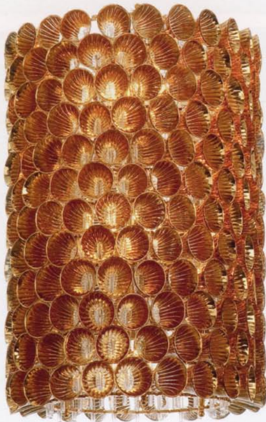
Gold Corail VERONESE