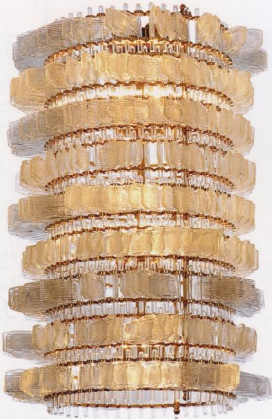
Crystal Anemone VERONESE