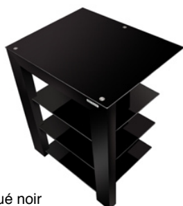
Finition laqué noir