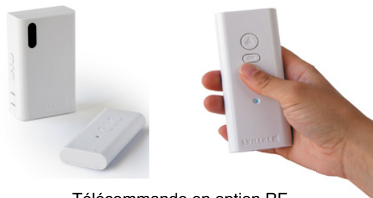
Télécommande en option RF