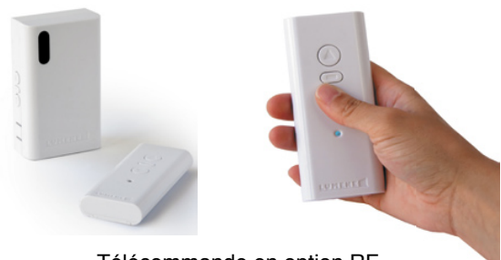
Télécommande en option RF